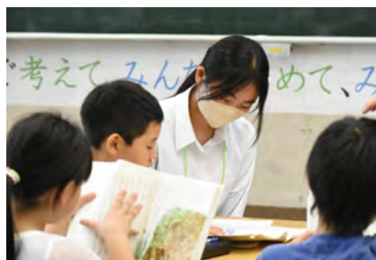
音読のサポートをする様子