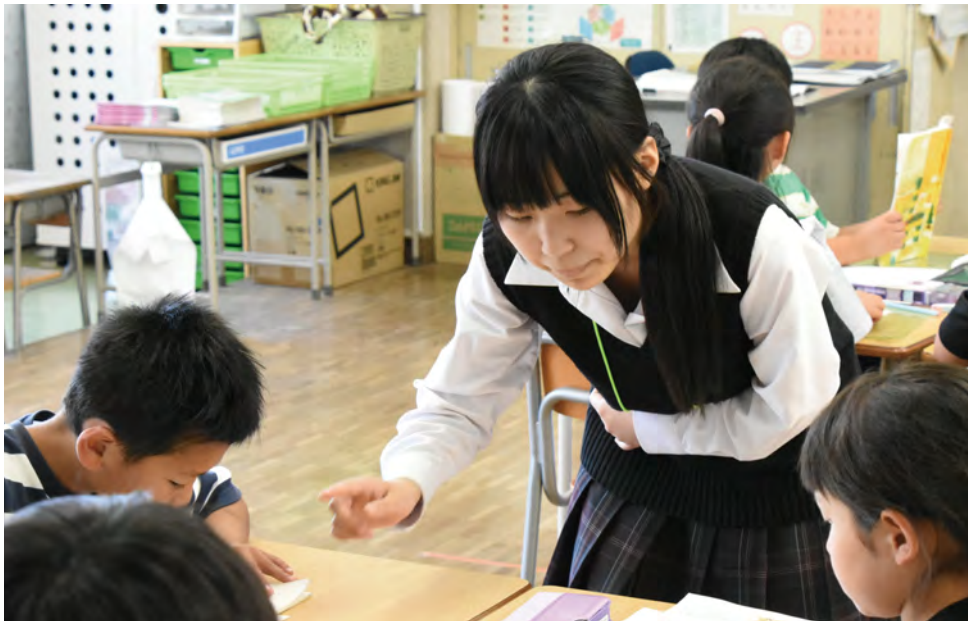
児童たちの作業の進み具合を確認しながら、漢字に振り仮名を付けるのを手伝う生徒

今年度から新設された選択科目「教職基礎」を受講する沼田高校の2年生9人は5月29日、沼田小学校で、教員の仕事を学ぶ実習に参加しました。