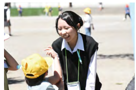
児童の様子を観察しながら、声を掛ける生徒