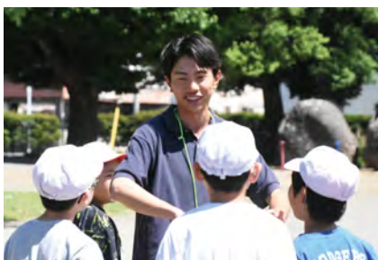
昼休みに児童と一緒に遊んでいる様子

「教職基礎」は教育や教師の仕事について探究を深めるための選択科目で、今年度は28人が受講しています。生徒たちは講義や体験活動を通して学びを深め、それぞれのテーマに沿って探究を進めています。